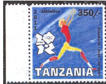
2. Tanzania Olympic 2011 MNH London 2012 Olympics – Athletics