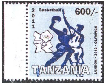
1. Tanzania Olympic 2011 MNH London 2012 Olympics – Basketball