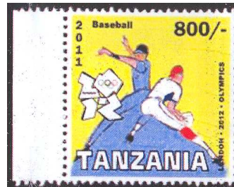
4. Tanzania Olympic 2011 MNH London 2012 Olympics – Baseball