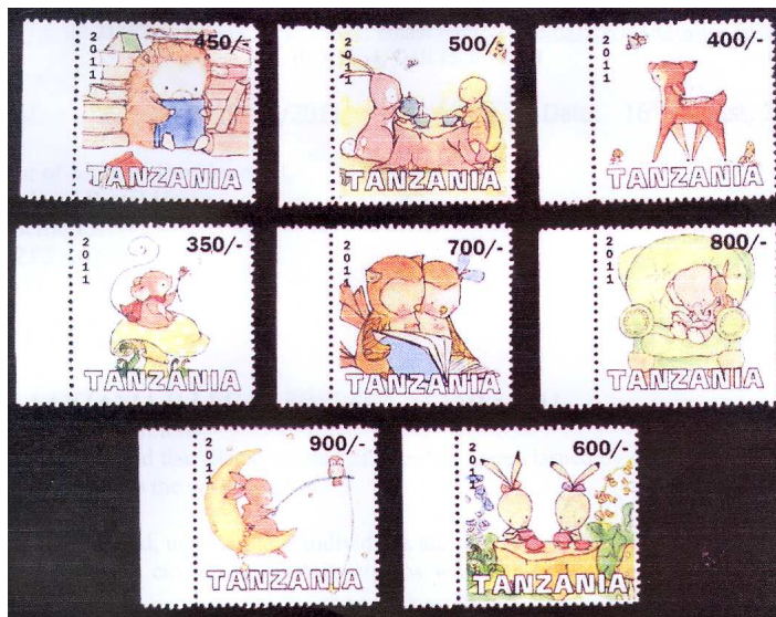
6. Children cartoon stamps 2011