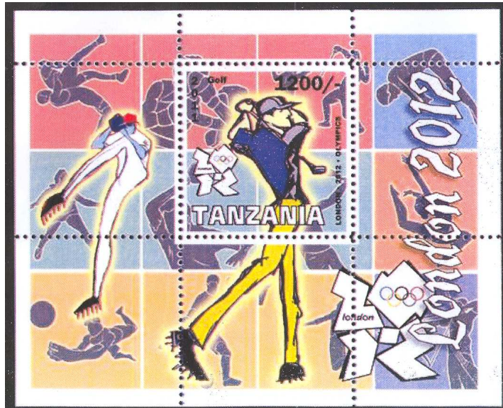
5. Tanzania Olympic 2011 MNH London 2012 Olympics – Golf