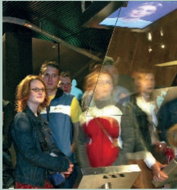
الاساليب الفنية للعرض الحديث المتطور تشجع التفاعل مع الزوار .