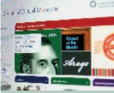
المتحف البريدي القومي بواشنطن يتيح الوصول الي مجموعاته من الانترنت