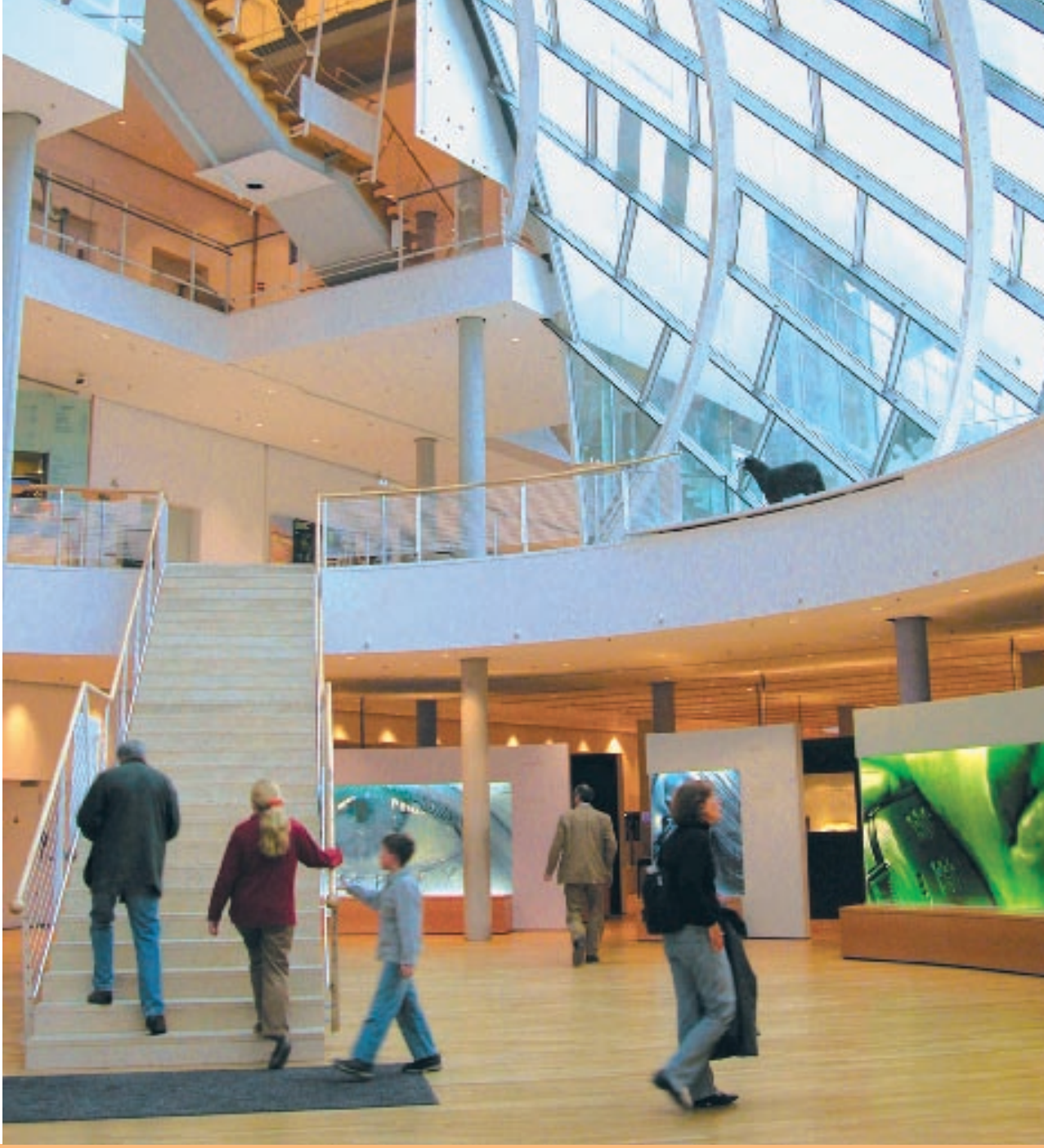
متحف الاتصال بفرانكفورت ( ألمانيا )