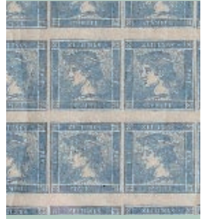
ثمانون طابع نمساوي بلو ماركوريز Blue Mercuries يرجع تاريخها الي عام ١٨٥١ . ولاتعرض سوي في المناسبات الخاصة مثلا ابان معرض موناكو فيل ٢٠٠٤