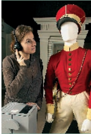
تثير قصص تاريخ الاتصال حماس الزوار

واشنطن ( الولايات المتحدة ) www.postalmuseum.si.edu