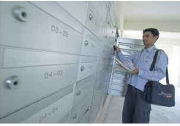
العنونة الموحدة قياسيا تسرع من التسليم وتقلل من تكلفة المعالجة والتوزيع.

وينوي الاتحاد البريدي العالمي فعلا أن يصير المرجع في مجال العنونة. ولبلوغ الهدف المنشود، يجب تشجيع هذا الأمر كعنصر أساسي لنمو اقتصاديات البلاد خصوصا الأقل تقدما. ولذا، تنصح وحدة «العنونة» به المستثمرين وتحلل احتياجاتهم وتشجع الحكومات على جعل هذا الموضوع مشروعا للتنظيم العمراني للأراضي. بايجاز، تقديم الإثبات للحكومات بأن قطاعات كاملة من الاقتصاد مرتبطة بنوعية العنوان.