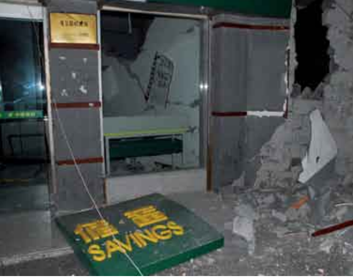
مكتب بريد في مقاطعة دوجيانجيان