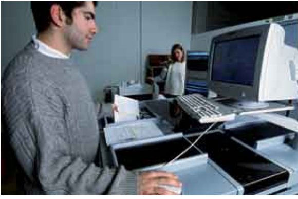
هل البريد المختلط هو الإجابة على تحديات ذات نطاق عالمي مثل ارتفاع أسعار النفط

أداة مقدمة أيضا في البلاد النامية تراجع مدة التوجيه بالرغم من ضعف البنية القاعدية، وتنمية الأسواق وارتفاع نوعية الخدمة: لقد فهمت البلاد النامية أيضا مزايا البريد المختلط.