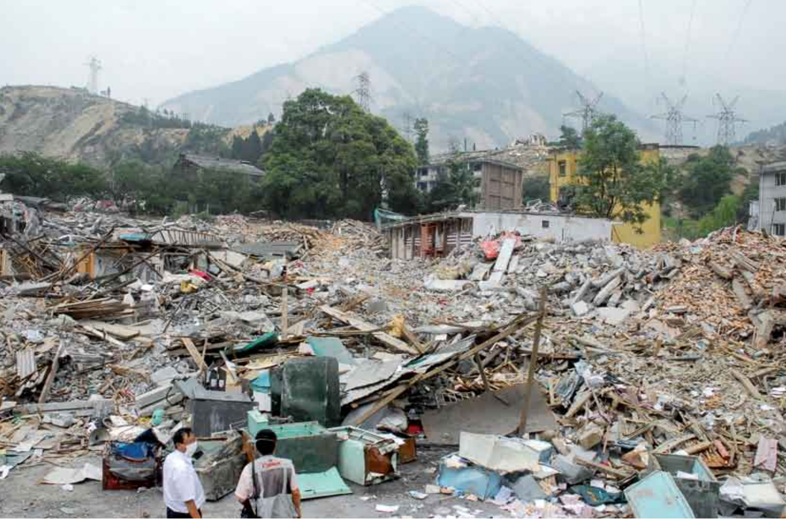
من مكتب بريد في مقاطعة شنغشيو، لم يتبق سوى الأنقاض

خطة لإصلاح المنشآت. أما الخسائر اللوجيستية فهي ضخمة. فقد تم إغلاق ٥٥ مكتب بريد ولكن تم استئناف العمل في ٢٢ مكتب بريد بالمناطق المنكوبة. ويتم تحت إشراف وزارة النقل، استخدام الحاويات والخيام والمنشآت سابقة التجهيز كمكاتب بريد مؤقتة لتقديم الخدمات الأساسية. وقد توقف توزيع البريد في ٩٥ مدينة وقرية. وبالنظر لحجم الخسائر، طلب مكتب الدولة للبريد من الحكومة ٧٨٥ منزلاً متنقلاً. وعلى أي حال يجب أن تدخل مسألة إصلاح البنية التحتية القاعدية البريدية في أولويات الخطة القومية لإعادة البناء.