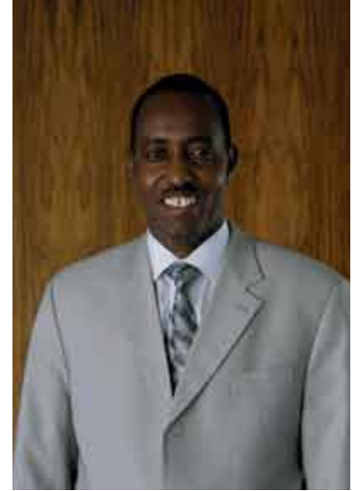
عينت كينيا السيد بيشار أ. حسين، رئيس المؤتمر البريدي العالمي.

وقد قال السيد حسين الذي أعرب أيضا عن سروره لعودته إلى الأسرة البريدية الدولية مصرحا: «إن المؤتمر يشكل فرصة فريدة لكي يقوم متخذو القرار ومخططو الاستراتيجيات والمنظمون والمستثمرون وشركاء