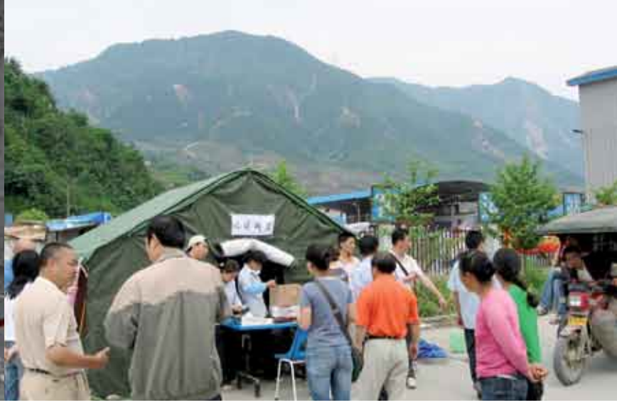
مكتب بريد مؤقت أقيم ببعجالة