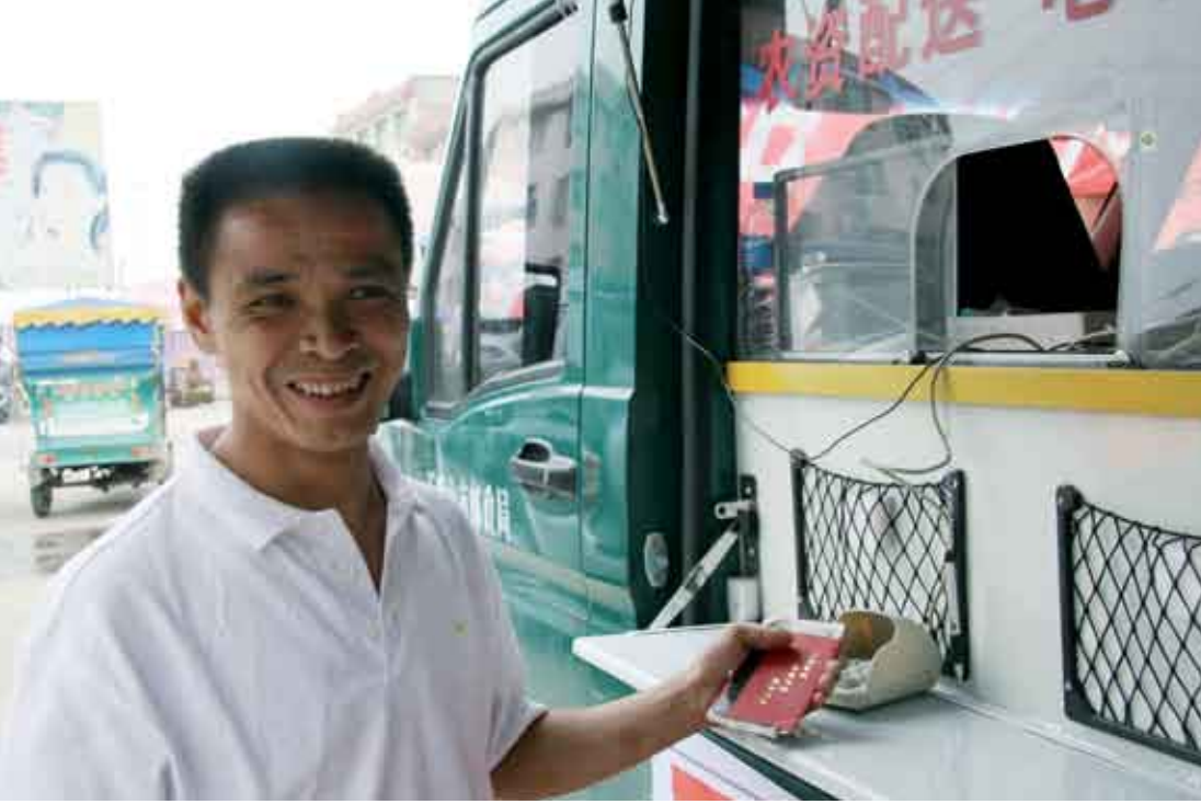
مكتب بريد متنقل في إقليم شوان

في ١٢ مايو/أيار الماضي، واجهت الصين إحدى الكوارث الطبيعية الأكثر فتكا خلال الثلاثين سنة الماضية .