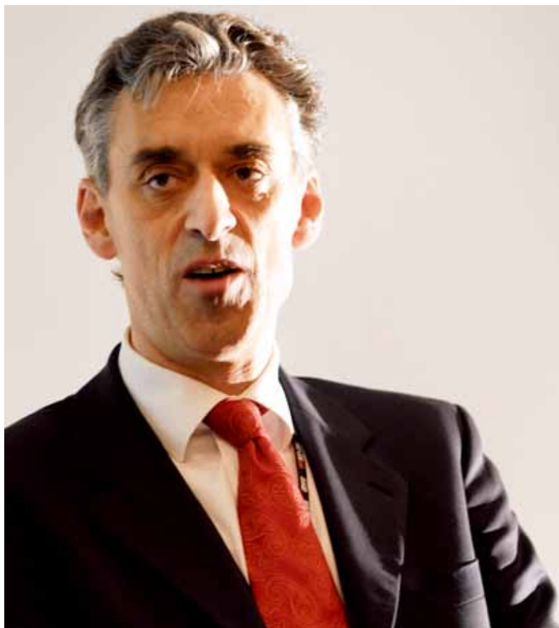
德国德政敦豪公司 Frank Appel

2009年邮政展览会（Post-Expo）期间，万国邮联组织的本年度世界邮政商业论坛吸引了众多邮政行业高层领导和与会代表。德国邮政敦豪公司、意大利邮政、韩国邮政、瑞士邮政和印度邮政的主要负责人在会议上做了讲话。万国邮联也借此机会公布了各国邮政在经济危机大潮中如何应对的研究结果。