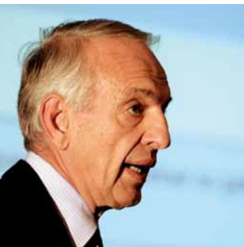
意大利僑政 Massimo Sarmi

与 2008 年同期相比，2009 年前三季度速递业务量也有所下降。由于燃油附加费的调整，速递业务收入明显下滑，今年第二季度下降率达到 20%。但是同样由于电子商务的成长和国际贸易的复苏迹象，该业务的形势也有好转趋向。