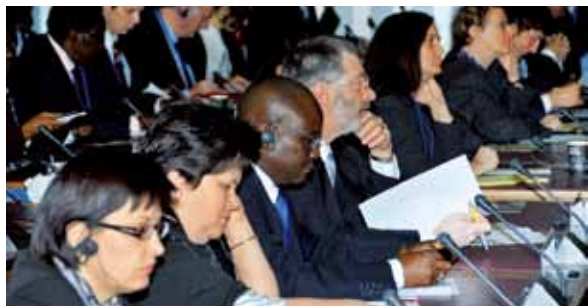
各方代表齐聚大会

万国邮联行政理事会 (CA) 2009 年年会审议了“.post”域名、金融包容性、邮政法规和可持续发展等重要问题。41 个理事国的 950 名代表出席了行政理事会会议，讨论和批准了邮联的工作和活动。四个委员会及其工作组讨论了管理问题、合作和发展、金融和管理及邮联战略。