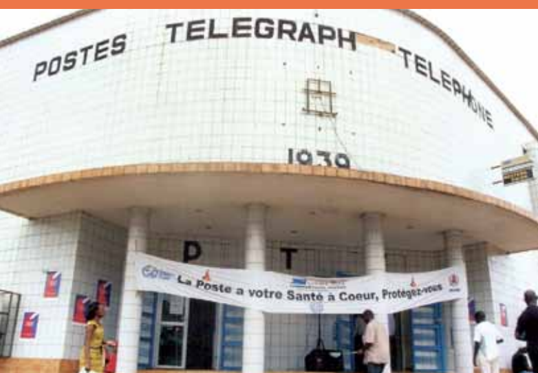
喀麦隆的一所邮局