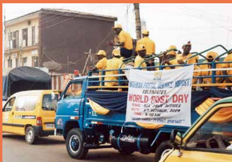
尼日利亚的宣传标语

和联合国功不可没。在它们的帮助下本次活动真正引起了公众和媒体的关注，因为此项宣传活动是和联合国千年发展目标相关联的。