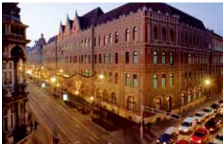
克罗地亚邮政总部

克罗地亚（Hrvatska）邮政宣布2009年的前9个月的运营收入为1.28亿克罗地亚币（0.262亿美元）。在2008财年，经营者直接亏损5000万克罗地亚币。