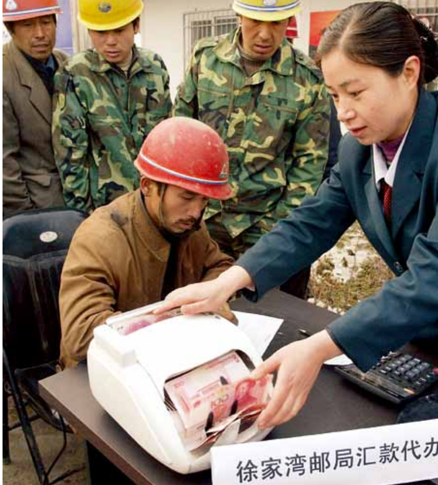
一名中国僑政员工正在为向家乡寄钱的移民办理业务。