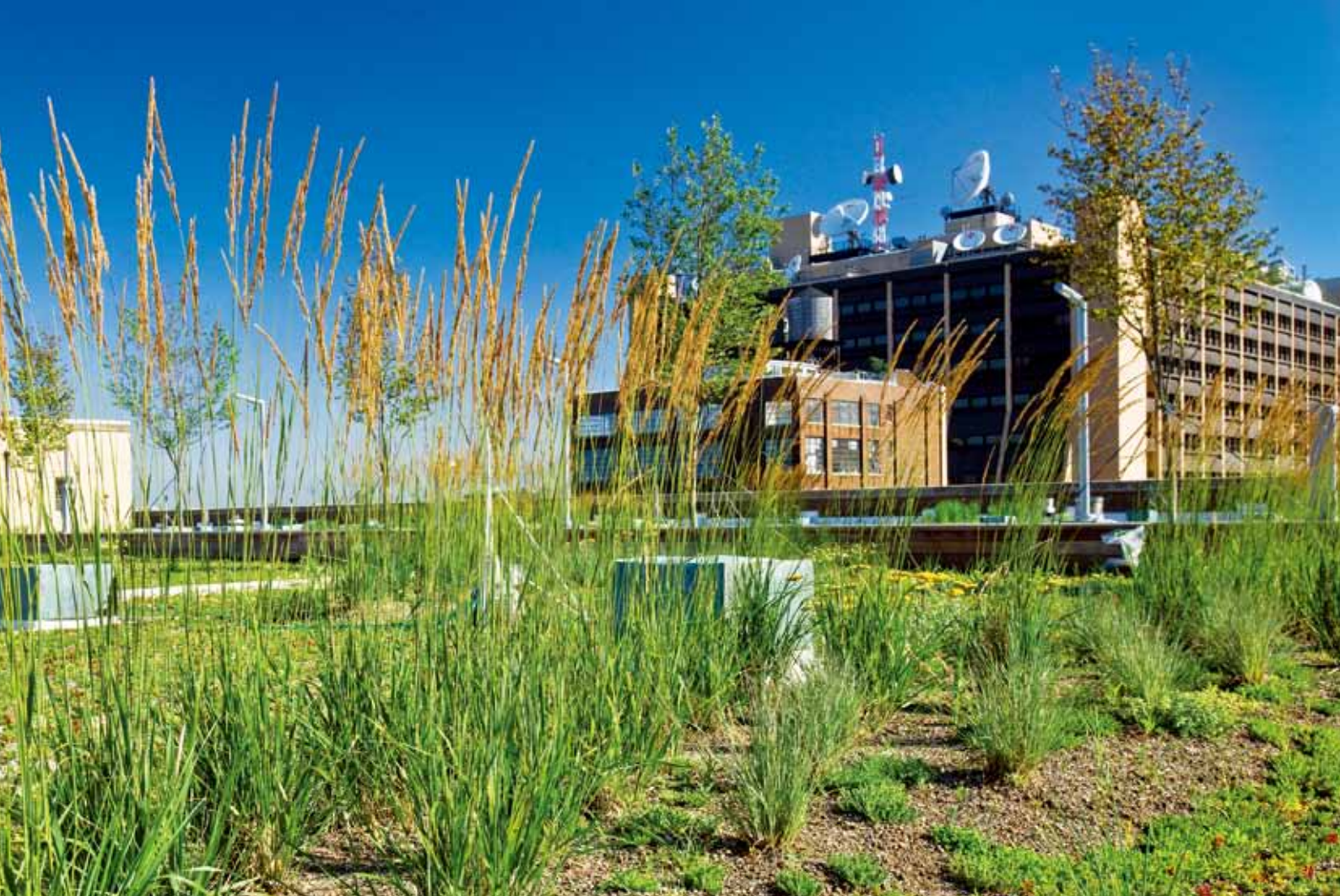
曼哈顿的绿色屋顶

动员活动，发行了有关气候变化影响的邮票。万国邮联 191 个成员国中已有 153 个应邮联要求指定了一名可持续发展国家协调员。