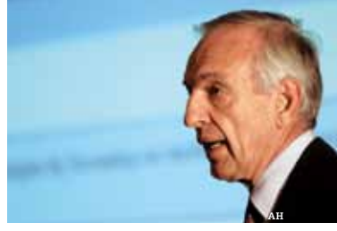
ماسيمو سارمي رئيس ومدير عام البريد الايطالي

«نحن نشهد اليوم حدثا تاريخيا. ففي منتصف القرن التاسع عشر، تم اختراع البرق. وكانت الوسيلة الأولى لنقل البيانات الكهربائية. وفي ذلك العصر، كان المستثمر البريدي فقط هو الذي يعرض الاتصالات المؤمنة بفضل هذه التقنية. وفي الوقت الحاضر، أي بعد قرن ونصف، يمثل نقل البيانات الإلكترونية وسيلة الاتصال الأكثر انتشارا في العالم ويتوفر لدينا البنية القاعدية الأكثر قوة منذ الأزل وهي الإنترنت. وبفضل الاتحاد البريدي العالمي، نتعاون لتطوير خدمات دوت بوست post. التي يتم ضمان تشغيلها المتبادل في العالم أجمع. علاوة عليه، سوف يعمل الباحثون في كل العالم على تحسين وتطوير وسيلة الاتصال الإلكترونية الجديدة التي يقدمها المستثمرون البريديون.