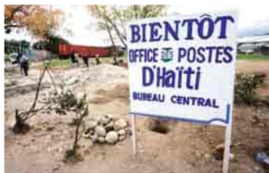
موقع مكتب التبادل بالقرب من المطار الجوي.