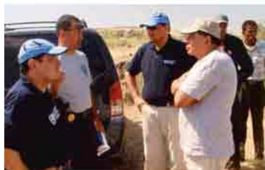
الفريق الدولي للاتحاد البريدي العالمي والخدمة للولاية للولايات المتحدة في هايتي خلال شهر فبراير/شباط.