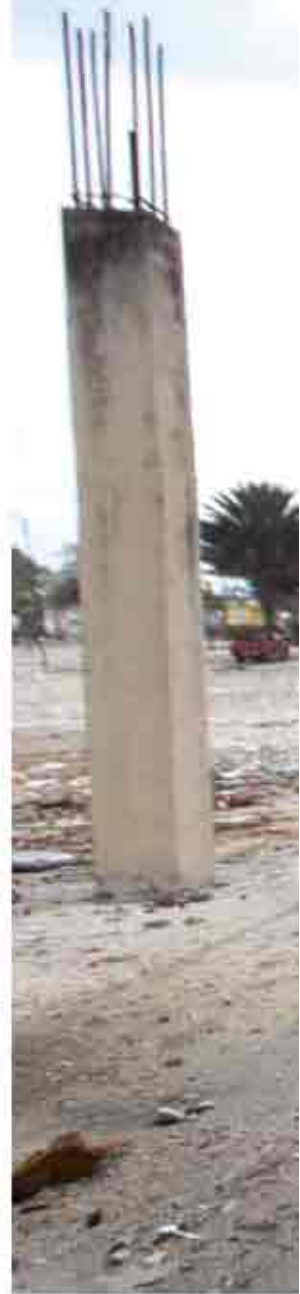
بالم رمان ليهلان

يقوم الفريق الدولي التابع للاتحاد البريدي العالمي بالإشراف على إقامة مكتب التبادل المؤقت وتنسيق العمليات البريدية الجديدة مع موظفي بريد هايتي. ويقوم أيضاً الخبراء بمساعدة عدد من الموظفين على الاستعداد للبدء في العمليات البريدية ويتم بالتالي تدريبهم عليها. وهم يأملون أيضاً إقامة منغذين بريدنيين آخرين على الأقل في العاصمة وعمالان كتفئتي إيداع وتسليم للبريد، ويقدمان الخدمات الأساسية للشباب مثل بيع الطابعات. وسوف يتم توفير النقل بين مركز المعالجة بالميناء الجوي ونقطة الاتصال المذكورتين.