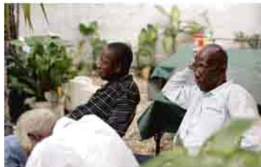
الموظفون بشبكة البريد نظفوا منازلهم يعيشون أيضا تحت تروياين في حديقة إميل.