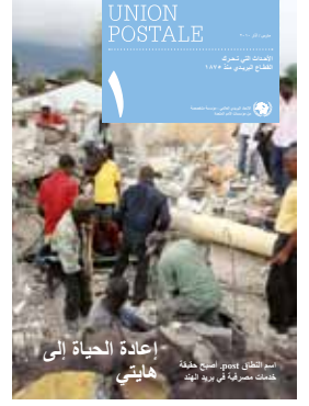
الغلاف: صوفيا باريس أنقاض مبنى خدمات البريد السريع بورأوبرانس، هايتي.