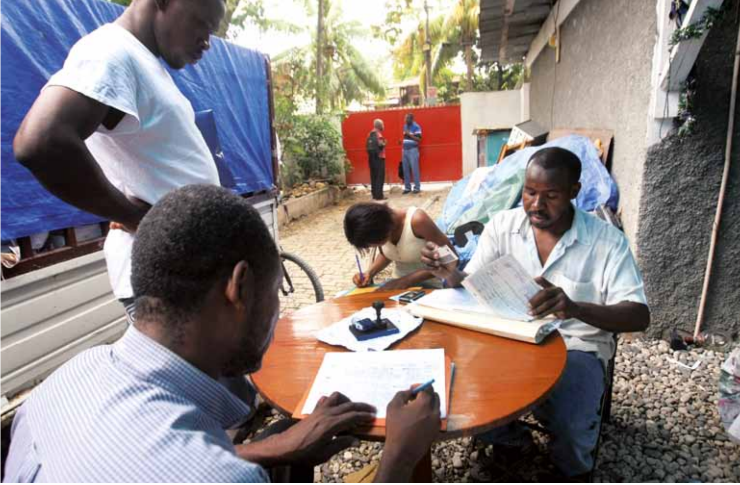
الموظفون يقدمون الخدمات الأساسية مثل بيع الطوابع من منزل المديرية العامة وبجانبهم سيارة شحن مغطاة بالنسيج ومملوءة بالبريد الذي تم جمعه من بين الأنقاض.

إنعاش الاقتصاد». وأضاف متحدثاً: «مع وجود من هايتي يعيشون في الولايات المتحدة الأمريكية و ١٣٠ ألفاً في كندا و ٨٠ ألفاً في فرنسا والعديد من الآخرين في أماكن أخرى، سوف تساهم إقامة خدمات بريدية فعالة في هايتي في تنشيط الاقتصاد والتخفيف من الصعوبات التي يواجهها السكان».