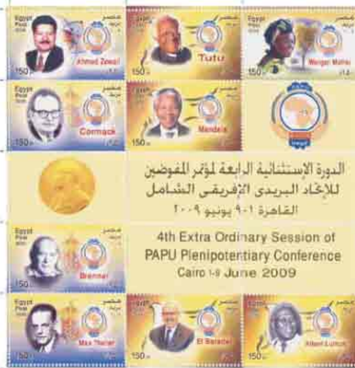
طوابع بريد مصرية مكرسة للفرز بجائزة نوبل

ولتتعبه للاتحاد البريدي العالمي، كان الهدف من المناقشات الخاصة بالمبادرات العلمية لزيادة الوعي هو الاستمرار في تناول موضوع البضائع غير المشروعة المرسل بالبريد في محيط مجلس الاستثمار البريدي التابع