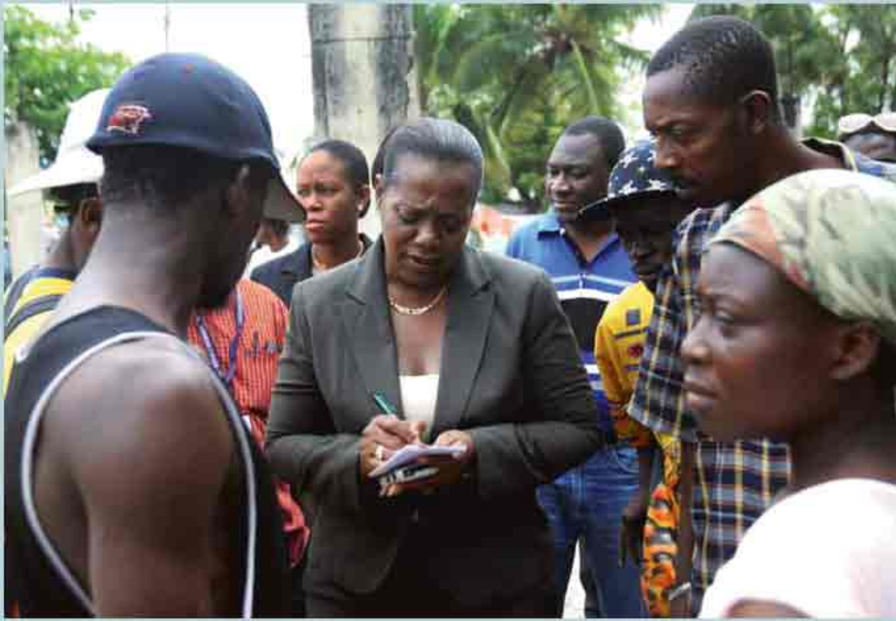
أيميل تكاب أسماء موظفي البريد الذين يبحثون عن عمل.

أصطتها الحكومة للخدمة البريدية بالحدائق الصناعية سونابو. وبعد ٣٠ دقيقة، يجب أن أكون هناك لأنه قد تم التعاقد مع شركة لبناء سياج أمان حول المساحة التي يقام عليها الهيكل المتنقل كي تبدأ في صليانها البريدية.