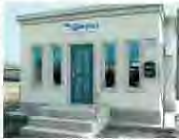
مكتب بريد بري في باكو

استثمرت الحكومة في طرق الاتصال الإلكتروني السريعة ووضع المشاورون الخارجيون نظاماً معلوماتياً جديداً. وقامت أمانة الدولة السويسرية المسؤولة عن الشؤون الاقتصادية، من جانبها، بتمويل تأهيل الموظفين وإعداد خطة استراتيجية متعددة السنوات. ولتحديد مستوى تأهيل العاملين، خضع الموظفون الريفيون بالمقر وفي المناطق لاختبار، على حد ما شرح مفك إدواردز. وقد أدى ذلك إلى فصل حوالي ألف شخص وإلى زيادة الأجر بالنسبة للعديد من المرشحين الذي لجأوا في الاختبار والموظفين الجدد (خصوصاً في المناطق الحضرية) وقد وجه برنامج التأهيل الاهتمام إلى الخدمة المقدمة للزبن والممارسات التجارية المتطورة. وحسبما أشار خبير البنك الدولي، فإن فوائد هذا التأهيل تظهر اليوم بوضوح في مكتب البريد.