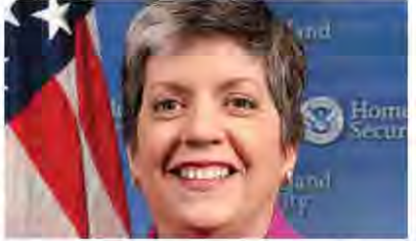
جائيت نابوليتانو مع جهود الاتحاد البريدي العالمي

التي يبتلها الاتحاد البريدي العالمي في سبيل وضع معايير دولية في مجال الأمن. وأشاعت أيضاً خلال حديثها إيمان اجتماع شهر يونيو/حزيران بالمنظمة العلمية للجمارك، بالجهود المشتركة الأخيرة التي بذلتها الاتحاد البريدي العالمي والمنظمة الدولية للجمارك ومنظمة الطيران المدني الدولية لدعم السلسلة العالمية للنقل البريدي.