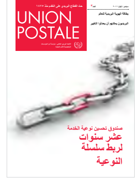
Die Gestalter: الغلاف