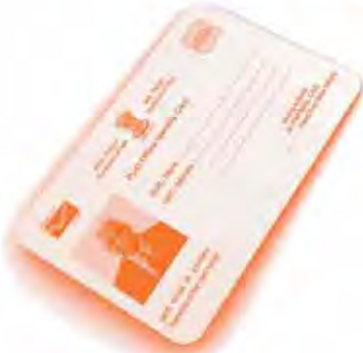
بطاقة يصدرها البريد الهندي

لهم بالتوقيع على المستندات القانونية والمالية والموافقة على المشتريات التي تتم على الخط. وقالت ناتالي سالامن، المتحدثة باسم البريد السويسري، مصرحة: «إن الحكومة السويسرية قد أطلقت هذا المنتج لتخلق شهادة هوية إلكترونية موحدة قياسيا في سويسرا». وأضافت قائلة: إن «هذه التوقيعات لها قيمة قانونية، ويبسط هذا الحل إلى حد بعيد المعاملات الإلكترونية، فعلى سبيل المثال، من الممكن الآن القيام بجميع الإجراءات الإدارية من أجل شراء منزل وذلك من على الإنترنت». إن الدخول إلى السوق كانت طريقة للتكيف بعالم يتحول. «لقد قمنا دائما بنقل الرسائل والجرائد والإعلانات. ولكن الأمر يتعلق هنا بسوق اتصالات مختلف حيث نتنافس مع الرسائل الهاتفية النصية القصيرة (اس أم اس SMS) والبريد الإلكتروني. ولا يسعنا أن نضيع فرصة التنوع الإلكتروني. فبدلا من تشجيع الزين على مواصلة إرسال الرسائل، ندخل سوق الخدمات الرقمية». وتشرح ناتالي سالامن أنه في الوقت الحاضر تولد خدمة الهوية السويسرية جزء صغيرا ولكن مهما من أرباح البريد السويسري بالمقارنة بقطاع البريد وقسمه المصرفي بوست فايننس. وقد أكدت قائلة: «نحن مؤسسة اتصال ويتعلق الأمر هنا بسوق اتصالات». «وهذه الأنشطة التجارية المتخصصة ربما تحقق أرباحا أقل الآن ولكنها أساسية بالنسبة لمستقبل مؤسساتنا». ر.ب.