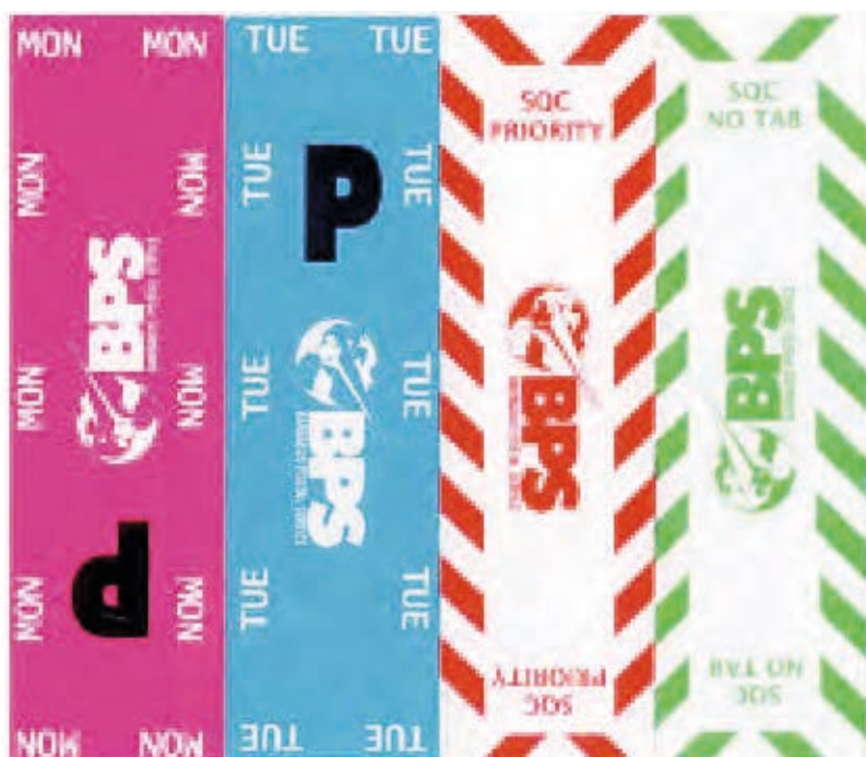
巴巴多斯邮政的业务质量监测标签

邦国有企业时，发现首先需要解决的问题之一就是服务质量较差。她说：“根据邮件测试系统的评估结果，服务质量一直很好。但是却有许多客户投诉服务太差”。