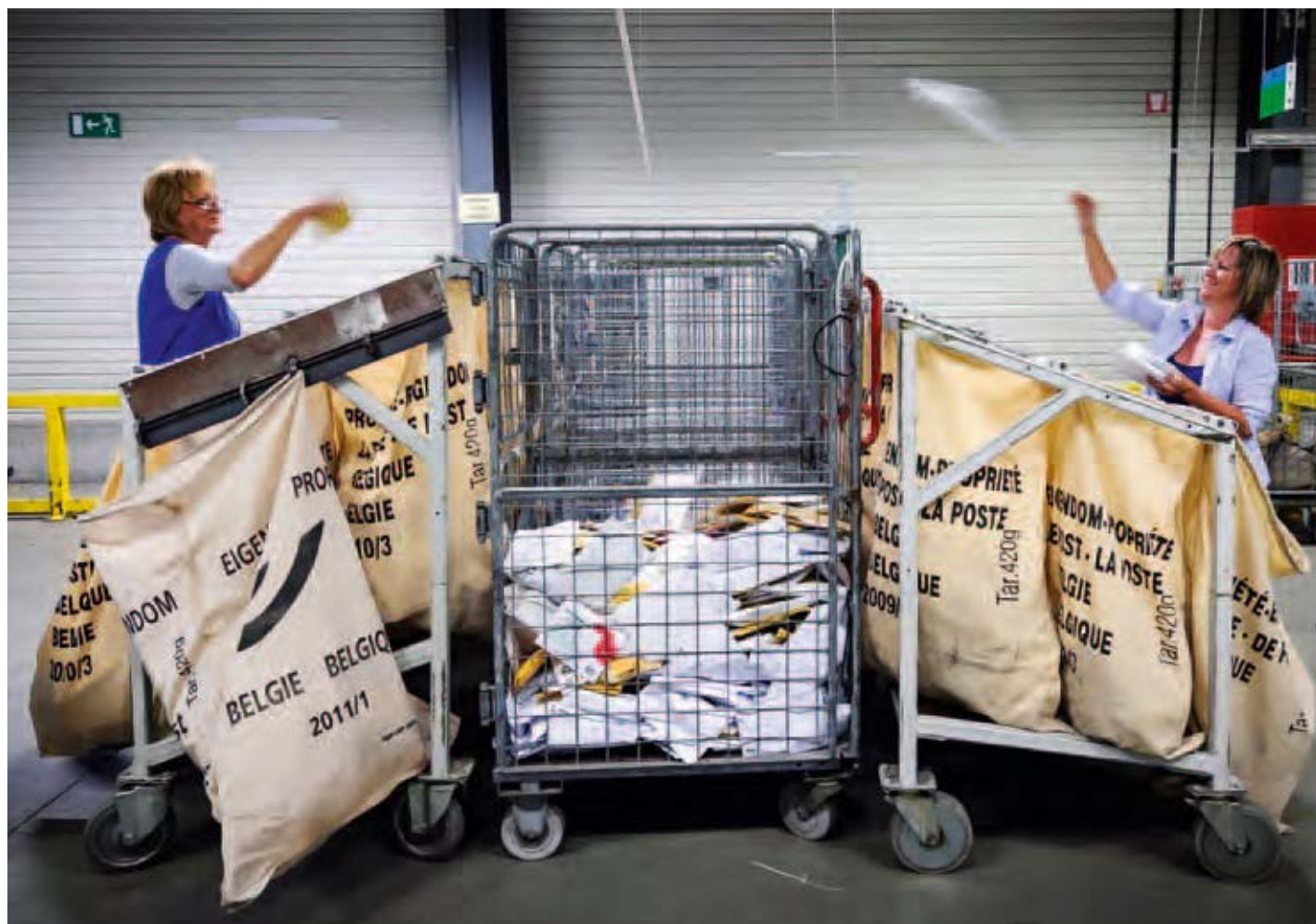
标准S58草案涉及保障邮政基础设施实体的安全问题，例如分拣设施。