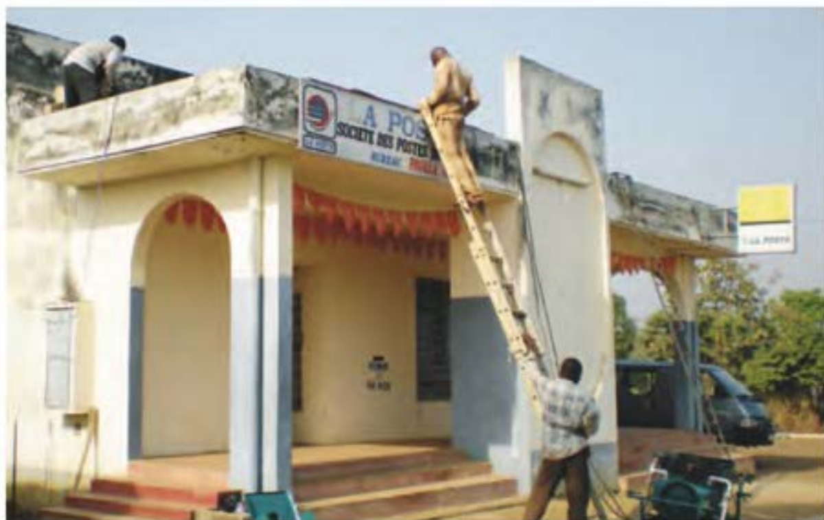
多哥帕加拉(Pagala)的一个农村邮局装上了太阳能板。