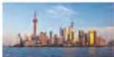
主办城市中国上海

长表示:新的大门也正向各邮政敞开。他解释说:“互联网时代的首个标志就是电子邮件和移动电话的出现导致传统函件业务量下滑”。