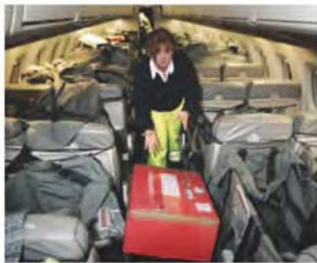
一名邮政员工正在从货机上卸载邮包。

万国邮联总局长达扬认为，国际协调应当成为主要方式。这项工作永远不会结束，因为问题不仅仅是行动，还要面对威胁未雨绸缪。达扬强调说：“因此，无论在行动中还是在预防措施与国际合作中，我们都非常有必要强化我们的角色。安全问题不仅要在国家范围内强调，也要在国际范围内强调”。他继续说：“单个国家很有可能无法通过有效途径找到解决办法，所以我们需要在国际层面上进行协调，我们需要把所有受影响的利益相关方团结到一起”。FM