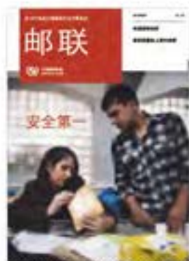
封面:2011年阿富汗喀布尔邮政员工