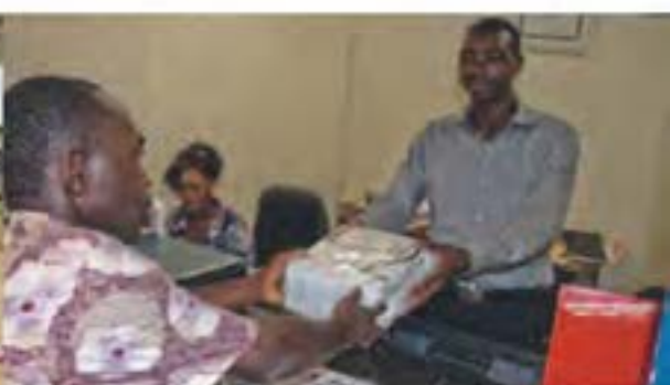
营业中的多哥洛美(Lome)邮局