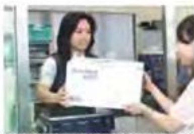
微笑服务

万国邮联数据显示,亚太地区在几个关键的服务质量指标方面都取得了进步。更多邮政可以为包括挂号信和包裹在内的各类邮件提供跟踪查询服务,并利用万国邮联的系统交换电子数据,实现信息互换,更好地管理邮件流。2008年,该地区只有15个国家提供包