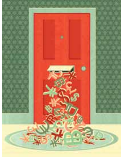
الغلاف: كوترينا زوكوسكيت