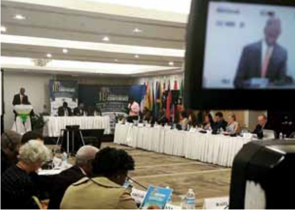
منطقة الكارائيني، جزر فيرجن البريطانية.

وقد طالب المستثمرين البريديين بأن يتحلوا بروح التجديد بمحاولة تطبيق نماذج الأعمال المختلفة وبإدماج التقنيات الجديدة وتقديم منتجات وخدمات تستجيب بطريقة أفضل للسوق. إن التكامل يعني، على حد قوله، تجاوز الحواجز أمام التوزيع عبر الحدود مع سلسلة عروض بريدية متواصلة. كما أبرز السيد بشار ع. حسين أن المستثمرين البريديين يجب أن يشجعوا الاندماج الاجتماعي والمالي والاقتصادي فهي جوانب حيوية لأهداف التنمية المستدامة للأمم المتحدة التي تم إقرارها