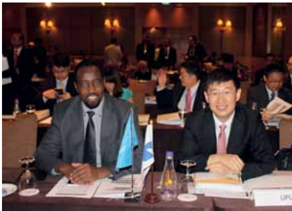
منطقة آسيا والمحيط الهادي، تايلاند

*Postal Union of the Americas, Spain and Portugal