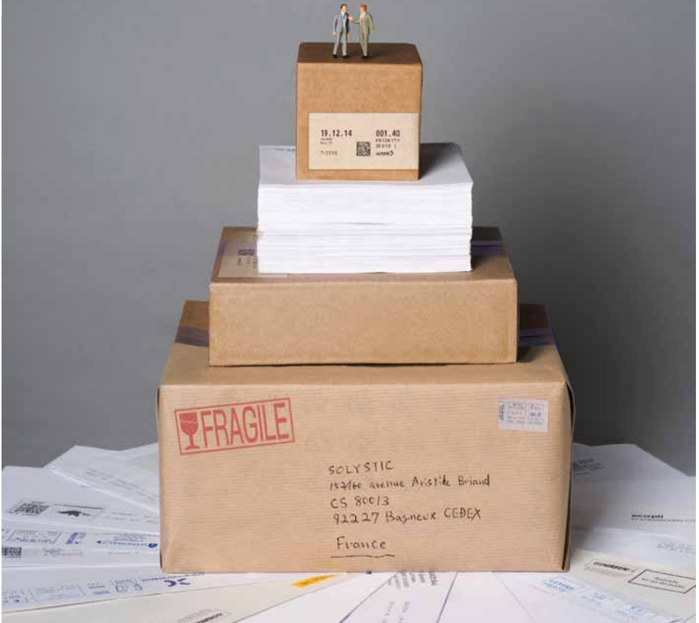
Photo credit: Janeth Rodriguez-Garcia - Peiser Figueiras Jack & Bill - Design: martiney