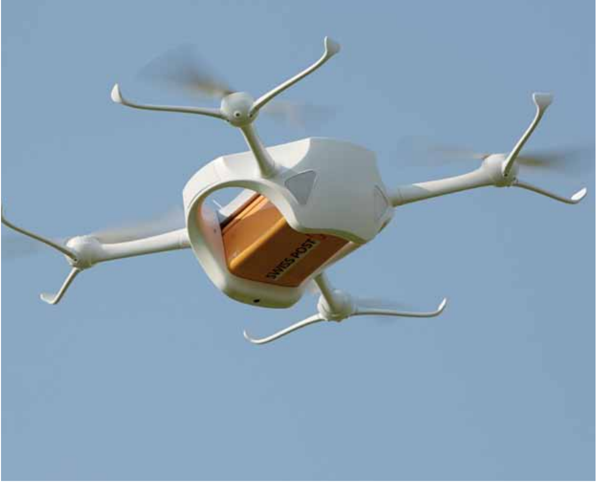
درونز البريد السويسري يطير