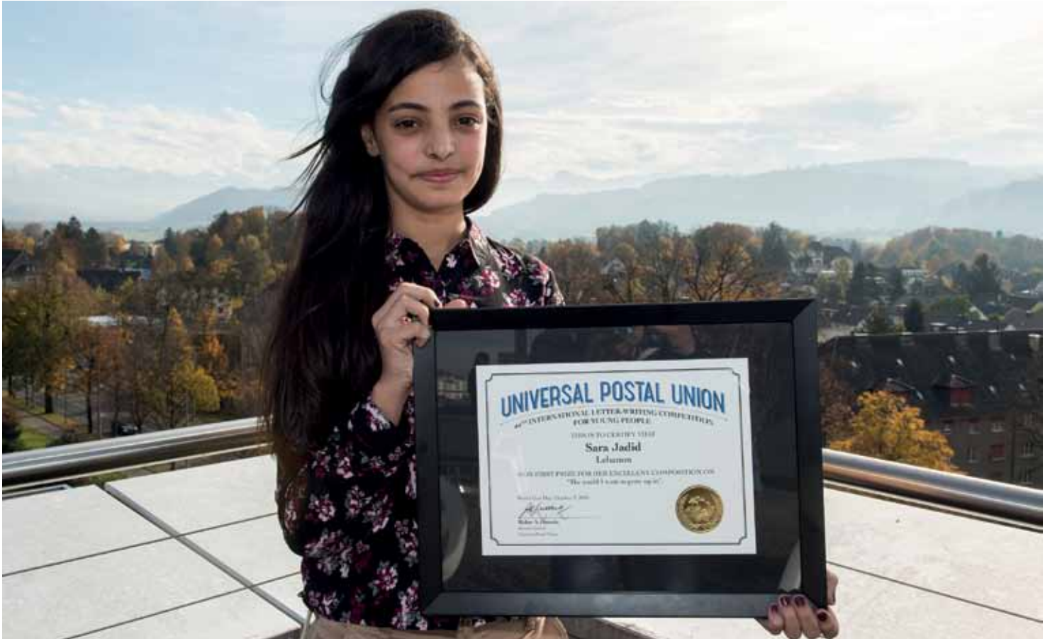
سارة جديد في برن