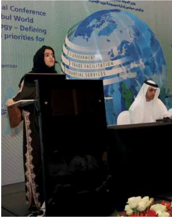
المنطقة العربية، الإمارات العربية المتحدة