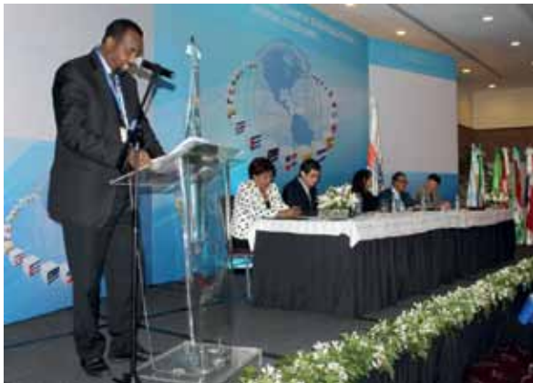
أمريكا اللاتينية ومنطقة الاتحاد البريدي للأمريكتين وإسبانيا والبرتغال، جمهورية الدومينيكان