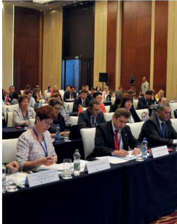
أوروبا وكومنولث الدول المستقلة، بيلاروس