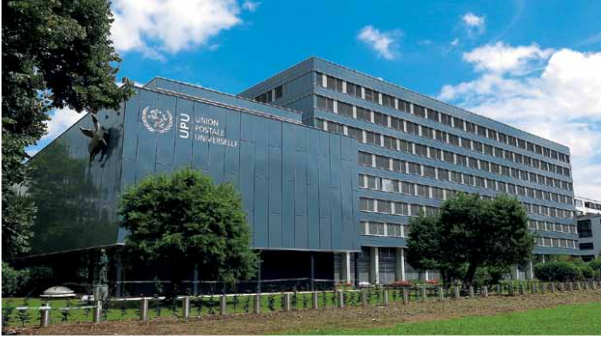
خلف هذه الجدران، المئات من المندوبين مجتمعين...

الاتحاد بما في ذلك اللجنة الاستشارية والمنظمات الاجتماعية المدنية وغيرها.