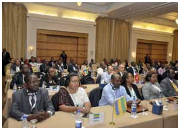
المنطقة الأفريقية، السودان

وقال: «سوف نزيل الحواجز أمام عمليات التوزيع البريدي عابر الحدود».