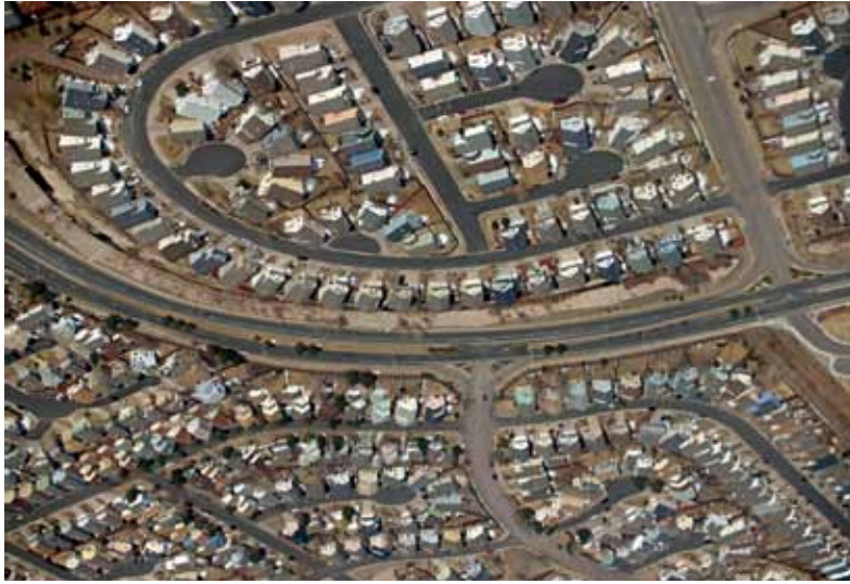
الزحف العشوائي للمدن

جعلت الهجرة الجماعية من المناطق الريفية إلى المراكز الحضرية وظواهر أخرى موضوع العنونة ضرورة ملحة في العديد من البلاد النامية وقد تمت مناقشة الموضوع خلال المؤتمر الأخير الذي عقد في مقر الاتحاد البريدي العالمي ببرن، سويسرا.